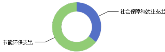
一般公共预算当年拨款结构图

2023年度一般公共预算当年拨款370.62万元,主要用于以下方面: 社会保障和就业支出131.93万元, 占35.60%; 节能环保支出238.69万元, 占64.40%。